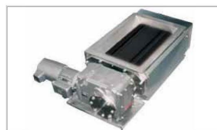
コンパクトなフィーダー部