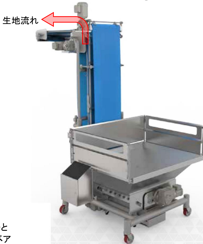
チャンカーと 縦型コンベア

ミキサーで捏ね上げた生地を、ゆっくり回転するブレードと縦型コンベアで穏やかに移送します。様々な種類の生地に対応。処理能力は最大30,000lbs (13,600kg) / 時間。