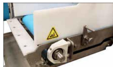
取り外しできるスクレーパー (工具不要)