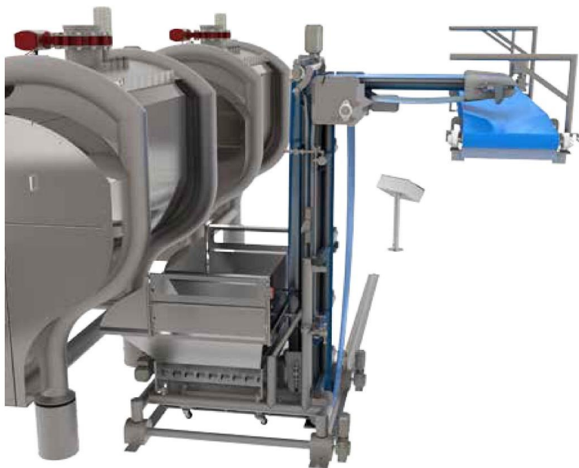
AMF社製ミキサーと組み合わせた、往復移動式チャンカー