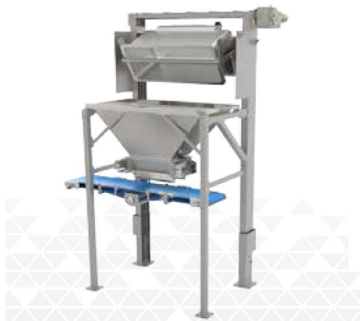
トローホイスト、フィーダー、及びコンベアの組み合わせ例