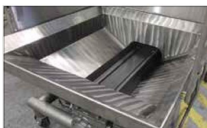
ホッパーサイズ 500~3400 LBS (220~1500 kg)

▼ステンレス製オペレーターコンソールは、安全で簡単な操作と、レシピ管理のできるタッチスクリーンインターフェース。